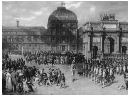
チュイルリー宮殿前での観兵式 (イポリット・ベランジェ画)

フランス革命後に、皇帝となつて欧州を席巻したナポレオンで、1808年、王権の象徴であるルーヴル宮殿と、イタリアのチュイルリー宮殿が、