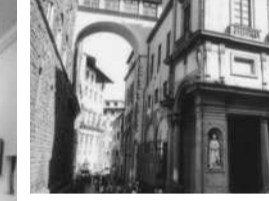
(フィレンツェ) ヴァザーリの回廊 ①ヴェッキオ宮殿～ウフィツィ美術館

フランス革命後に、皇帝となつて欧州を席巻したナポレオンで、1808年、王権の象徴であるルーヴル宮殿と、イタリアのチュイルリー宮殿が、