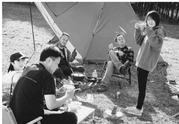
休日は同僚とキャンプへ (右端が本人)

の建築現場の様子を毎日見てきた。建設業に対しては、日に日に完成に近づいていく現場にただただ感心する。仕事柄、道路工事が終わって、真新しい道路が完成すると、とてもうれしくなる。