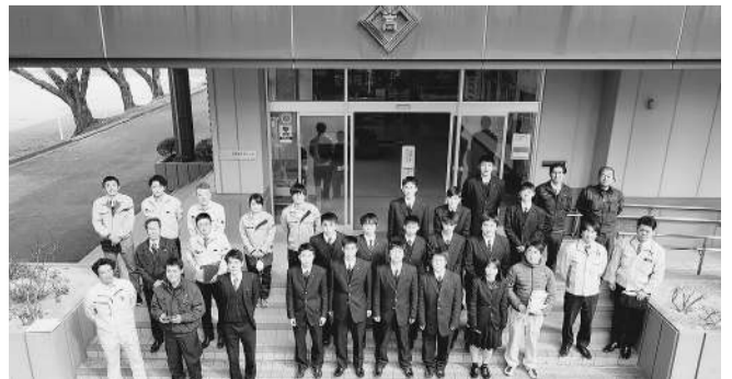
ドローンでの記念撮影実習