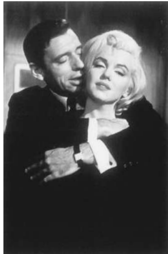
「恋をしましよ」で共演したモンタンとモンロー