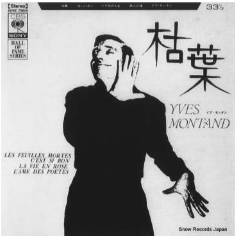
イヴ・モンタンの「枯葉」のレコードジャケット

「若いころお互いに愛し合っていた二人が別れざるを得ず、それぞれ別の人生を送ったあと、再び出会った時には、北風に吹かれて舞う枯葉のようだった」という感傷的で余情あふれる