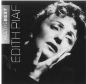
フランスで最も愛されている歌姫 エディット・ピアフ