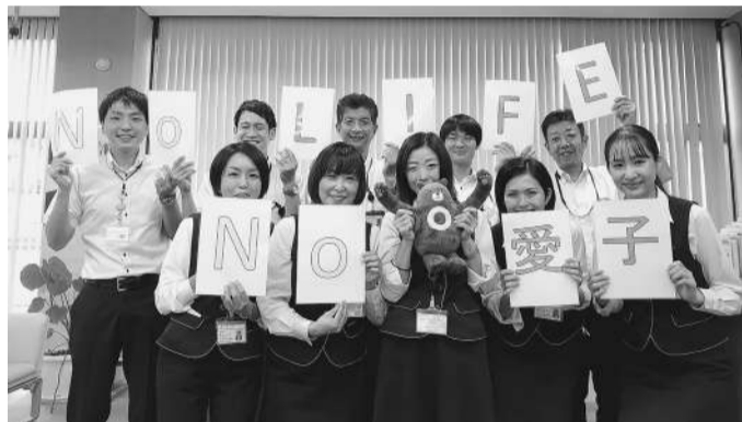
富士見支店の同僚と(本人前列右端)

趣味は旅行。お寺・神社巡りが好きで、「コロナが落ち着いたら三重の伊勢神宮に行きたいです」とほほえむ。1998年4月3日生まれの23歳。伊東市内にお住まい。