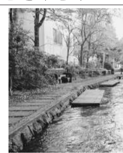
源兵衛川を流れる富士山の湧水

スポーツとして注目を浴びていますが、昔から金持ちだけのスポーツといえませんが、アマチュアイメージが払拭されず、対外的には公言していませんが、実は「ゴルフが好き」とは公言していません。 私がゴルフをやり始めてしばらくすると、AO Nが全盛期の時代となる中、162cmの小さな体の杉原輝雄プロは、全盛期のAO Nに果敢に挑み、永久シードになった選手です。