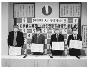
大仁警察署と災害協定締結 伊豆の国市建協など3団体

伊豆の国市建設業協会(携した地域住民の為に協定。大変心強い」と話し、土屋会長は「人命救助の協定は業界にとって新しい取り組み。防災力強化につながる」と述べた。