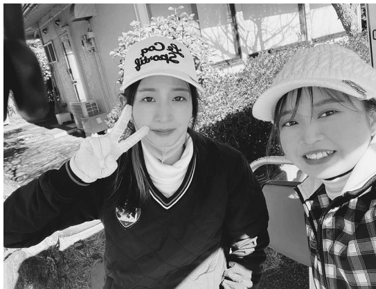
職場の同期と伊豆大仁CCでゴルフを楽しむ(本人右)

韓国がマイブームで、アイドルのEXO(エクソ)や韓流ドラマが好き。「コロナが落ち着いたら韓国旅行がしたいです」とほほ笑む。