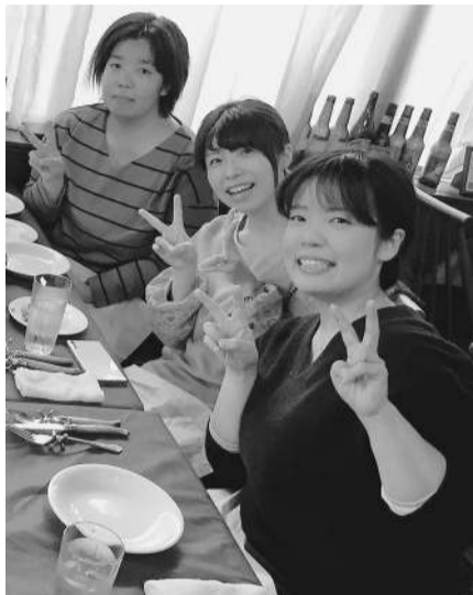
友人と食事会 (本人右)

ブランドの『いつものいいもの』をはじめとしたお土産品、伊東市内の工房で作られた工芸作品やクラフト作品など、さまざまな商品を取り扱う店舗の運営を任されている。「地域を活性化させる仕事は初めての経験で、日々勉強することばかりですが、とてもやりがいのある仕事」だと感じている。