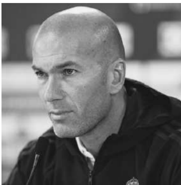
仏サッカーチームで大活躍したジダン

2006年のFIFAワールドカップの決勝戦(フランス対イタリア)において、「頭突き事件」を引き起こしたフランス代表で、現在レアル・マドリードの監督を務めているジネディーヌ・ジダンは、アルジェリア移民2世で、マルセイユ郊外の貧困層が多く住む地域で育った。つまり、フランス南部にあって、地中海岸に面するマルセイユは、古くからアルジェリアを始め、地中海岸の国や都市とはそれだけ近い関係にあり、また、フランス国内ばかりでなく、遠く北欧からも保養に訪れる温暖な国際港湾都市だ。