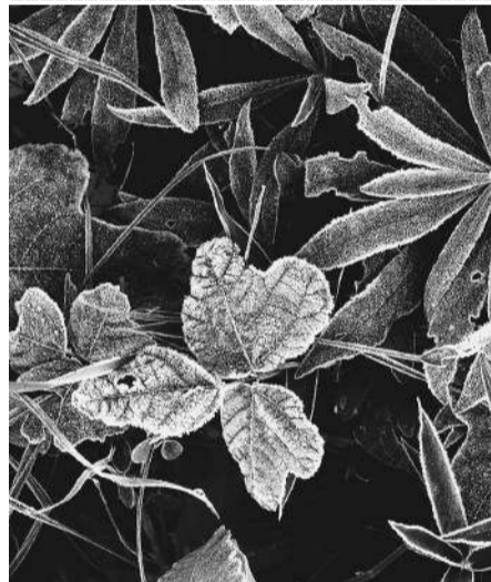
葉に纏う霜は、凍てつく朝の薄化粧（三島市内）

土木の道を志したの は高校時代、通学時に通っていた大井川に架かる富士見橋で車と歩行者の接触事故が頻発しており、「ここに歩道橋をつくれなにか」と考えたことがきっかけ。大学で土木を学び、「地元静岡で仕事したい」という思い