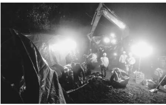
夜を徹しての復旧作業

早期に着手することができました。水道資材の調達、水道資材メーカーと近隣自治体の協力により、施工中の工事現場から口径500mmの耐震型ダクタイル鉄管を融通してもらったことができたため、大幅に工期が短縮されました。また復旧工事の肝となった旧設管と新設管をつなぐ特殊異形管は、休業中の工場を稼働していただき、わずか3日で製作が完了。工程の遅延を防ぐことができました。