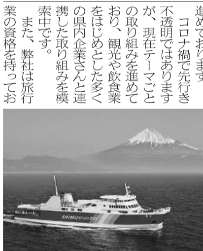
また、弊社は旅行業の資格を持つお

甲板に子ども達が自由に落書できる「駿河湾に浮かぶキャンパス」の設置、就航先の神社仏閣と連携した乗船者限定の駿河湾フェリー乗船記念御朱印の発行などを行っております。 また、今後、沼津高専と連携し、駿河湾に住むイルカの群れが、いつの日かフェリーと並走して常時見られるよう研究を進めてまいります。 コロナ禍で先行き不透明ではありますが、現在テーマごとの取り組みを進めており、観光や飲食業をはじめとした多くの県内企業さんと連携した取り組みを模索中です。 また、弊社は旅行業の資格を持つお