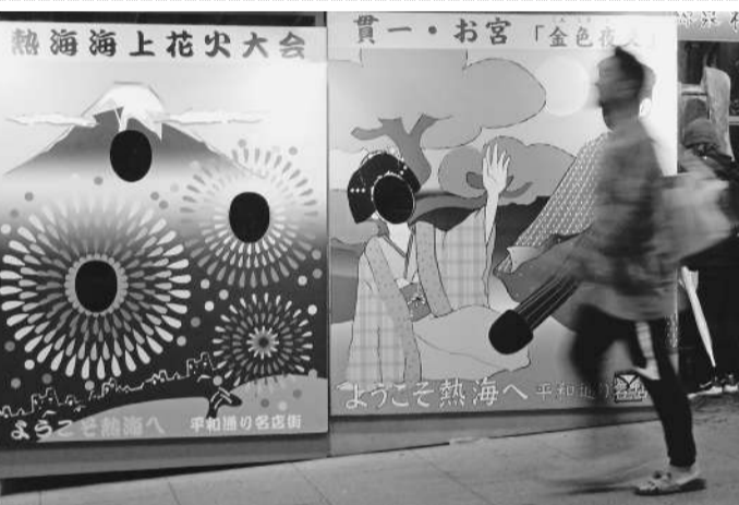
深まる秋、貴方が主役の熱海へお出でませ(熱海市内 撮影 村上益男氏)

沼津土木事務所(原広司所長)関係で2社が表彰された。東部農林事務所(塚本忠士所長)の優良建設工事表彰式が8月31日、沼津土木386件、東部農林67件、合計453件の会員からは沼津土木関係も建設業の発展と若い技術者の育成に努めてほしいと受賞者来賓として出席した小野徹会長は、評価制度に対し、土木事務所と農林