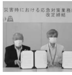
災害時における応急対策業務に関する協定書 改定締結 令和2年9月