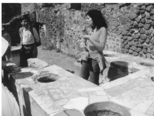
ワインでもてなす居酒屋もあった!