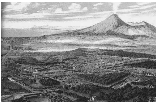
ポンペイの想像図

「歩車道分離!」のための「飛び石の横断歩道!」や、左右に商取引場や食品市場、洗濯