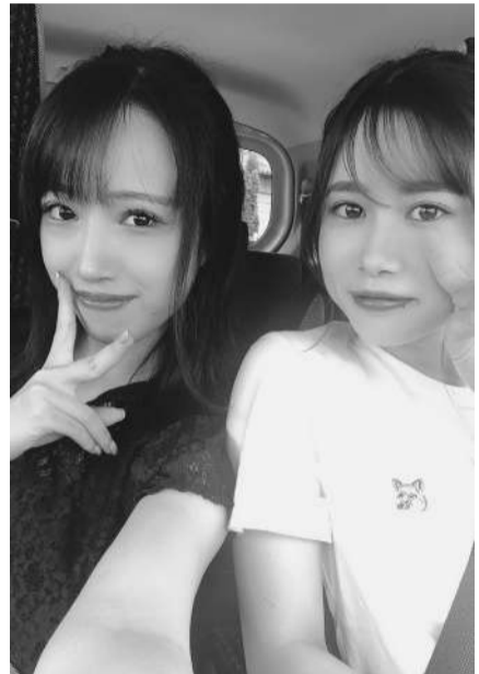
友人とドライブで一コマ (本人右)

趣味は刺繍とスケートボード。1997年10月17日生まれの22歳。伊豆市内に父と母、姉と妹の5人でお住まい。お隣が祖父の家で、とても仲がよいそうだ。