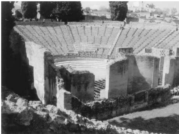
屋根付きだった円形劇場