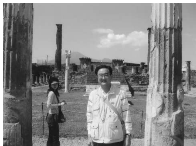
神殿はヴェスヴィオ山に向いている