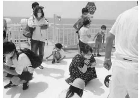
「駿河湾に浮かぶキャンパス」に落書する子ども達

甲板に子ども達が自由に落書できる「駿河湾に浮かぶキャンパス」の設置、就航先の神社仏閣と連携した乗船者限定の駿河湾フェリー乗船記念御朱印の発行などを行っております。 また、今後、沼津高専と連携し、駿河湾に住むイルカの群れが、いつの日かフェリーと並走して常時見られるよう研究を進めてまいります。 コロナ禍で先行き不透明ではありますが、現在テーマごとの取り組みを進めており、観光や飲食業をはじめとした多くの県内企業さんと連携した取り組みを模索中です。 また、弊社は旅行業の資格を持つお