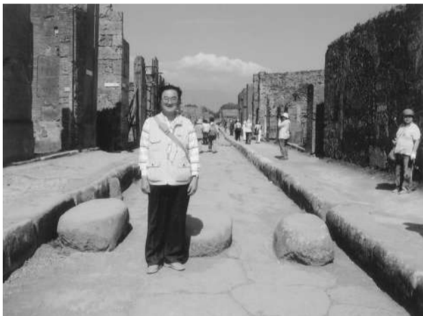
飛び石の横断歩道と大きな熔岩ブロックで舗装された道路

この日までに、かなりの火山灰も降り、地震も頻発していったことから、人口一万余人から二万五千人の、大部分の住民は避難を始めており、樂觀的な住民二千人が、突如襲った火砕サージ(高温の砂嵐)の犠牲になつたとされている。