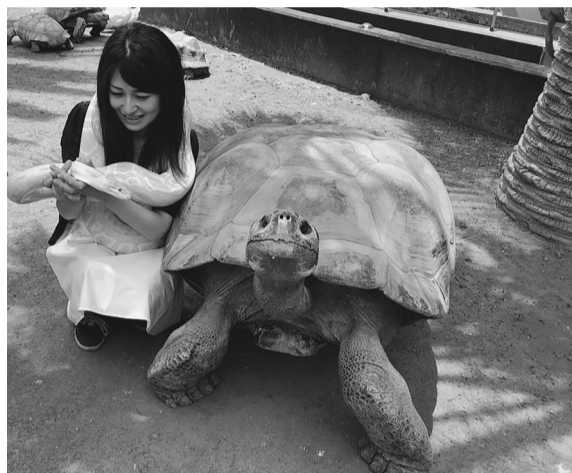
体成型動物園 iZoo での一コマ

「自国の教育改革のために」スポーツを取り入れようと考えたクーベルタンであったが、いつしか、慢性的な争いを起こしていた古代ギリシャの各ポリス（都市）が、4年ごとに、汎ギリシャの「古代オリンピック」を開催していたことに倣い、「古代オリンピック