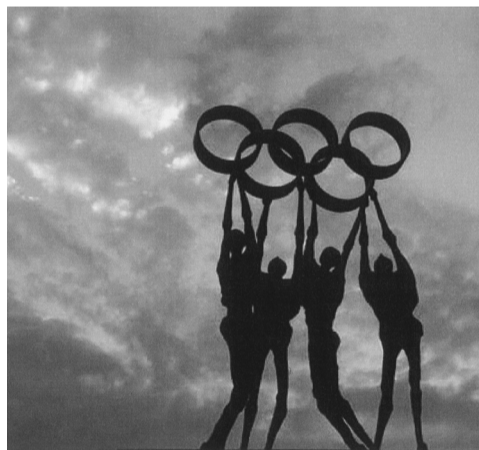
ローザンヌ(スイス)のIOC本部前の記念碑

から、クーベルタンは、英国のパブリックスクールのラグビーなど、心身ともに鍛える教育に興味を持つとともに、古代ギリシャでも「肉体と精神の調和」こそが、優秀な軍人を育てるのに有効だと考えられていたことを知り、フランスの閉塞した状況を打開するには、スポーツを取り入れた教育改革を推すしかない、と考えるに至ったのであった。