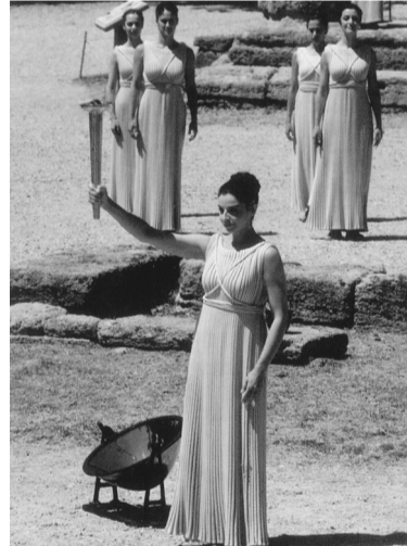
聖火はアルヘラ・オリンピアの神殿跡で採火される

た。この「古代オリンピック」に刺激を受けたのが、普仏戦争の敗戦で沈滞ムードが蔓延していたフランスの、貴族の三男、若きピエール・ド・クーベルタンであ