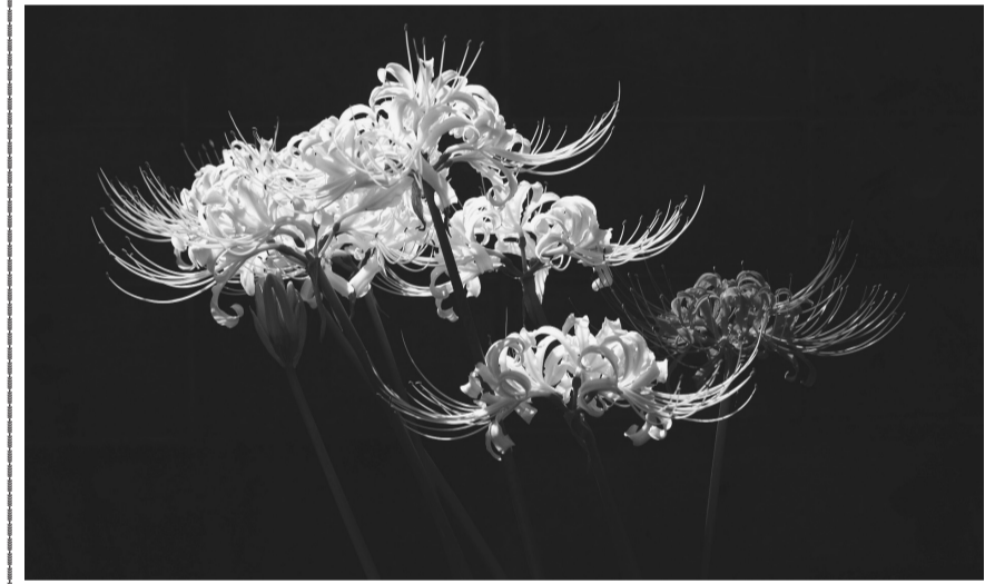
凜として、力強く秋空を仰ぐ曼珠沙華 (三島市内)

津土木事務所在籍して、津波対策地区協議会を担当したことなど、それぞれ、「地元の人たちと話し合い、お互いの共通点を見つけていくことに尽力した」という、「苦勞もあつたが、いずれも合意形成を図ることができた」と充実した様子だ。