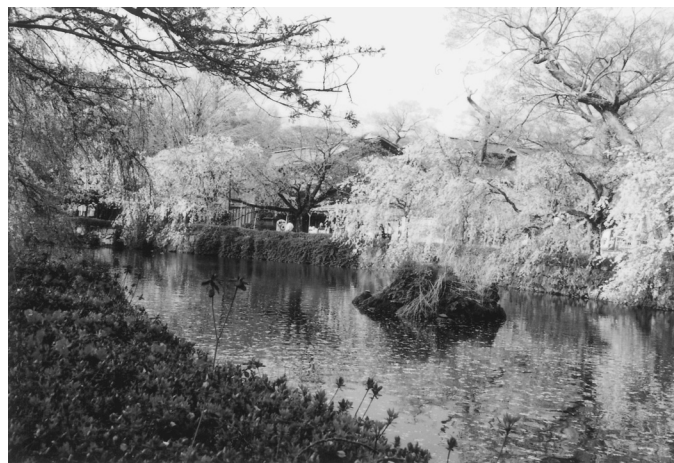
水面を彩る満開の桜、春爛漫の華の舞（三嶋大社 ）