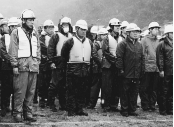
訓練に参加した会員は山本建設、駿豆建設、中林建設の3社。また、三建会員の数社が訓練を視察した。

藤井所長は、「一連の流れを訓練で確認し、関係機関相互の体制強化につなげた」と話した。