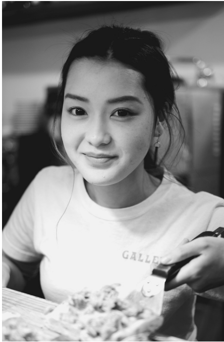
本格ローマスタイルのピザ。 テイクアウトもできる

2017年10月にオープンしたイタリアンカフェ・パールで、本場さながらのロースタイルのピザが評判を呼んでいるほか、イタリア製のエスプレッソマシンで