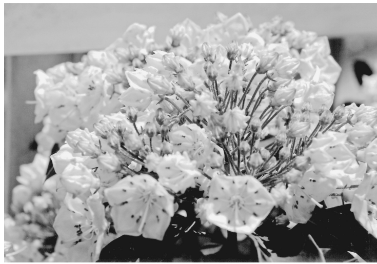
初夏の色、華麗な衣装を纏うカルミアの花（三島市内 ）