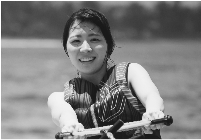
ウェイクボードを楽しむ

趣味はスポーツ全般。特に、「マリンスポーツが好き」で、この季節の週末は、ウェイクボードやウィンドサーフィンをして、各地の海岸へ出掛けることが多い。伊東市出身。父、母、兄、弟の5人家族。