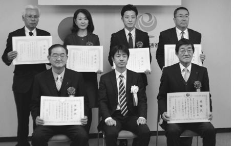
三建会員3社に感謝状 沼国 災害対策関係功労者表彰