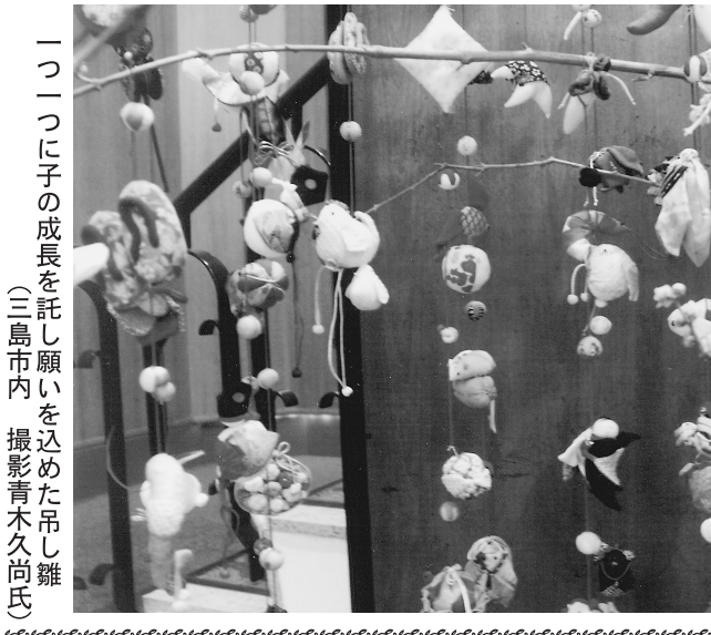
一つ一つの子の成長を託し願いを込めた吊し雛 (三島市内)

当日は山中城跡の主要箇所や箱根旧街道を巡るウォーキングに加え、バイパスの開通式も御覧いただける内容となっております。 ◆歴史ウォークの概要◆ 開催日時：平成28年3月12日(土) 9時～12時(予定) 集合場所：山中城跡駐車場(静岡県三島市山中新田地先) 募集定員：先着100名 参加費：無料 申込方法：沼津河川国道事務所ホームページからお申込みください。