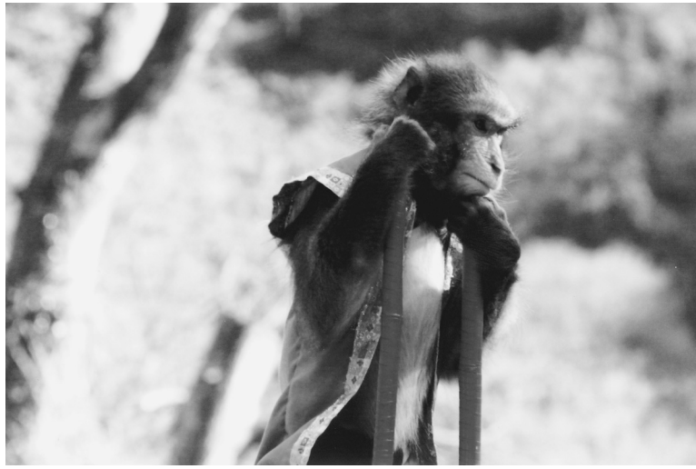
今年「申年」オレの年、景気浮揚た、引掻き回せ こや出陣 (熱海梅園)